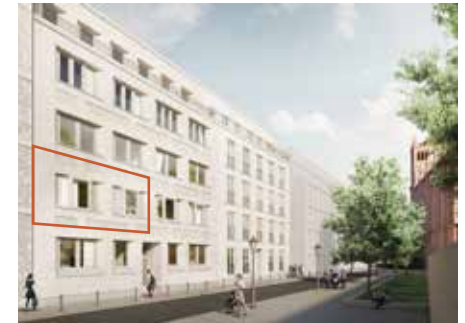
Stadthaus Niederlagstraße 3 Wohnung links, 1. Obergeschoss 3 Zimmer, ca. 73 m 2