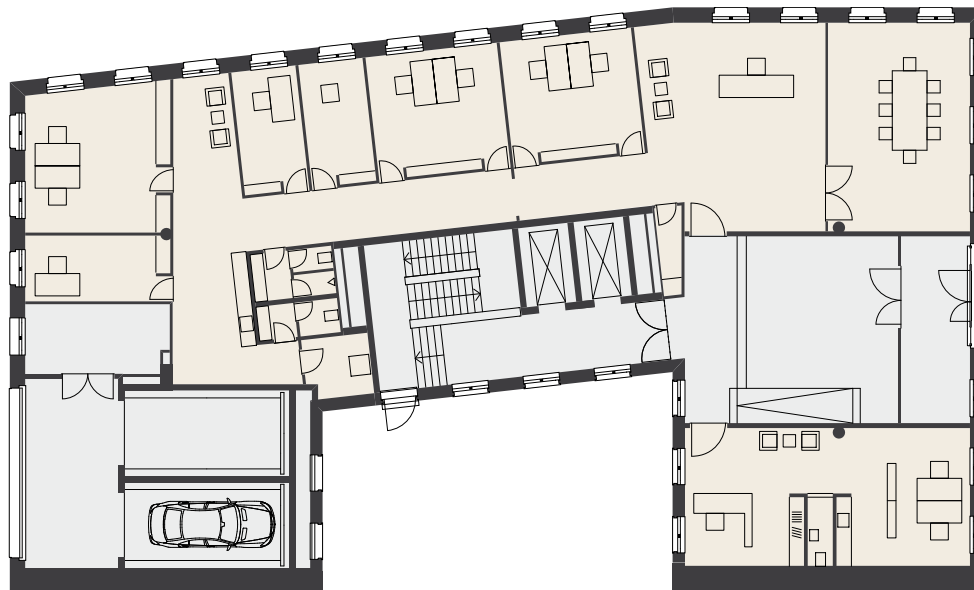
Beispiel zur Grundrißgestaltung