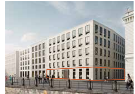
Büroetage, Schinkelplatz 5 Erdgeschoss, ca. 429 m 2